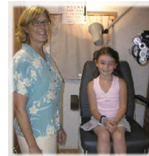
Examen de la vista recepción de niño.

Si la evaluación detecta la posibilidad de que un niño tenga un problema de visión, los padres del niño son notificados e informará de ello. Es imprescindible que los padres establecen un examen de la vista con un ojo profesionales tan pronto como sea posible. Si hay un problema financiero para cubrir el examen y tratamiento para que Medicaid u otros