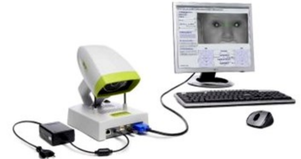
PlusOptix S09 Siste-

El proceso de selección es no invasivo, simple y rápida. La cabeza del niño se coloca frente a la cámara de PlusOptix S09 y se toma una fotografía digital. Las fotos son evaluadas en tiempo real para determinar si puede ser un problema de visión.